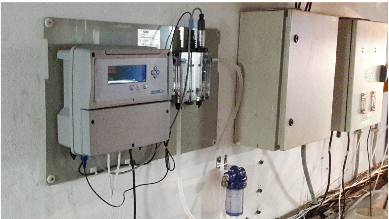
FAC dosing control panel