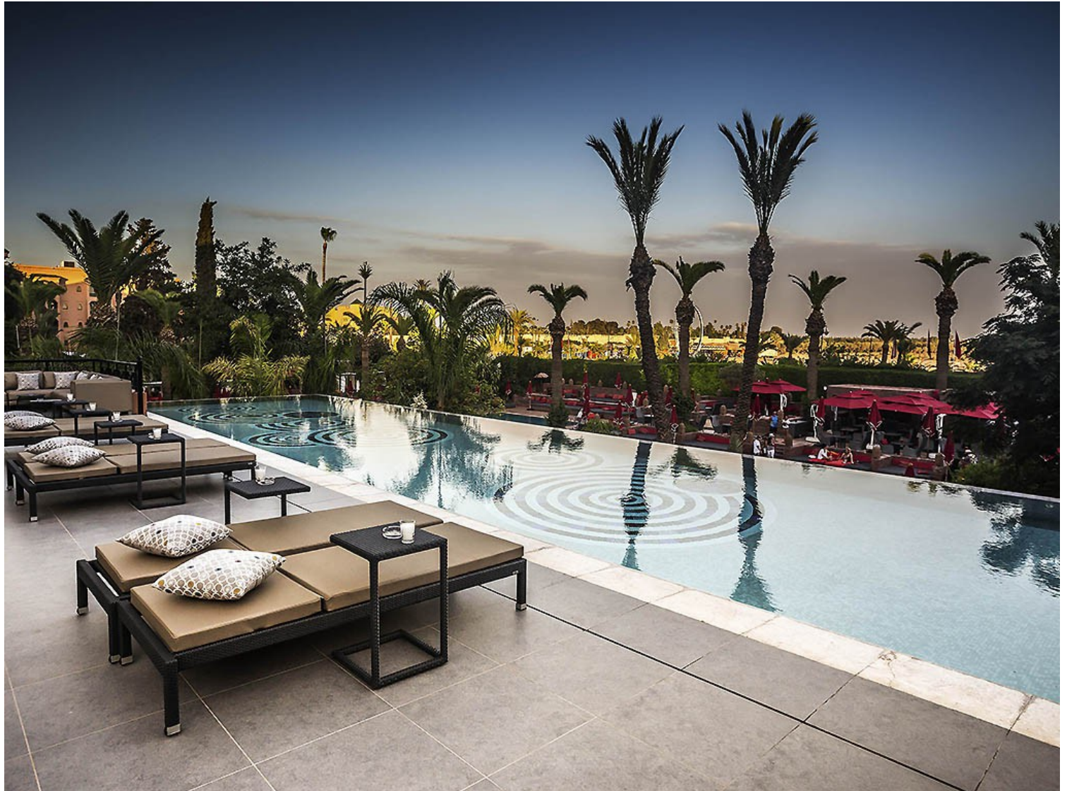
SOFITEL HOTELS & RESORTS