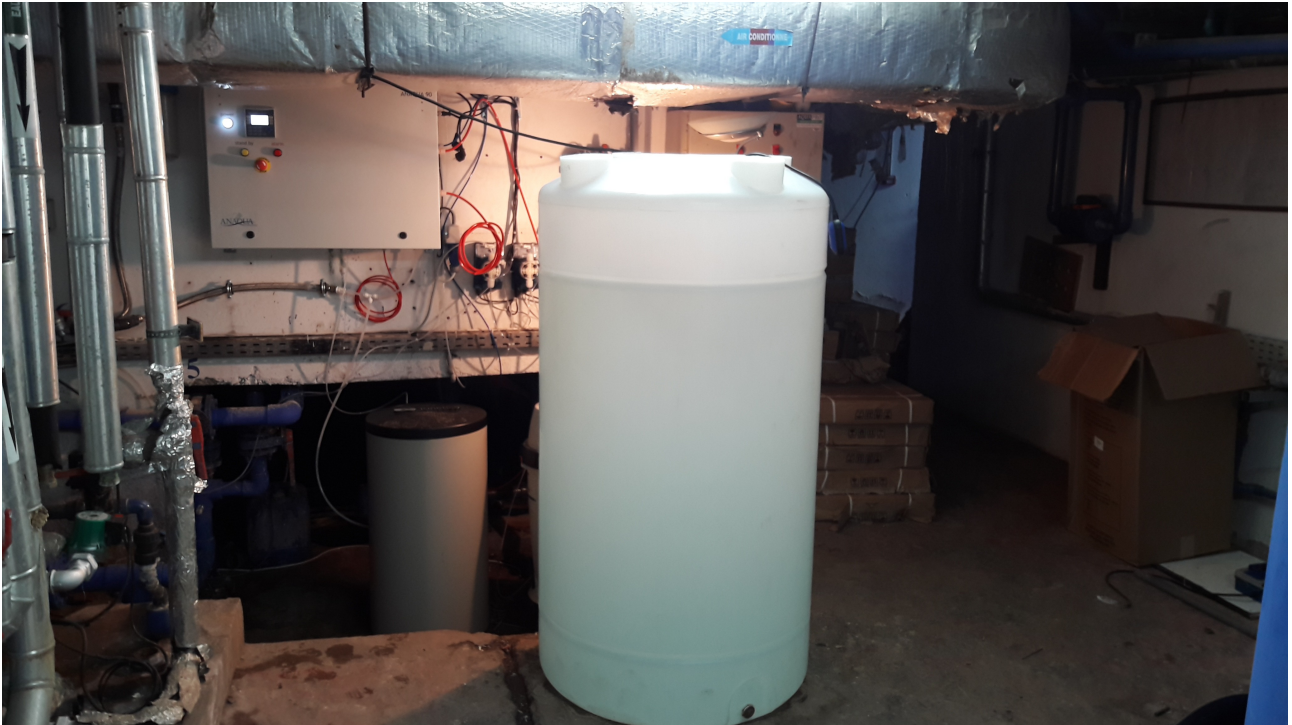
Envirolyte ELA-900 with anolyte tank

Swimming pool: 80 m 3 Anolyte dosing: 0,1% FAC residual in the pool: 1,3 ppm Type of Envirolyte equipment: ELA-900